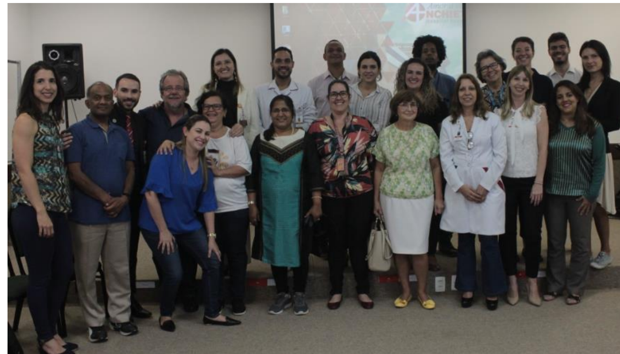
Participantes do Workshop sendo recebidos pela equipe do Hospital Anchieta