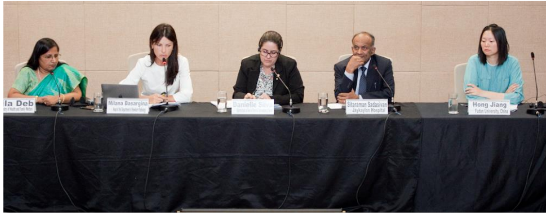
Mesa composta pelos representantes de Brasil, Rússia, Índia e China

A segunda atividade do Workshop foi a realização do Painel “Panorama dos Bancos de Leite Humano nos países que integram o BRICS” – no qual os representantes da Rússia, Índia e China apresentaram o “estado da arte” do aleitamento materno e bancos de leite humano em seus respectivos países. O painel permitiu conhecer como cada país lida com o tema Banco de Leite Humano em seus respectivos contextos de saúde pública.