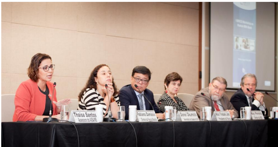
Mesa da Solenidade de Abertura