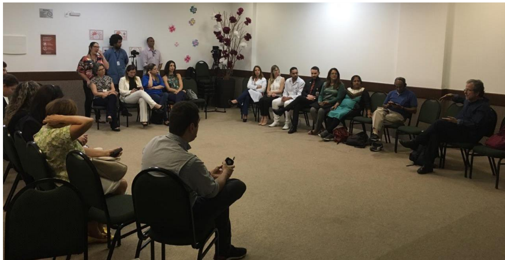
Fórum de discussão