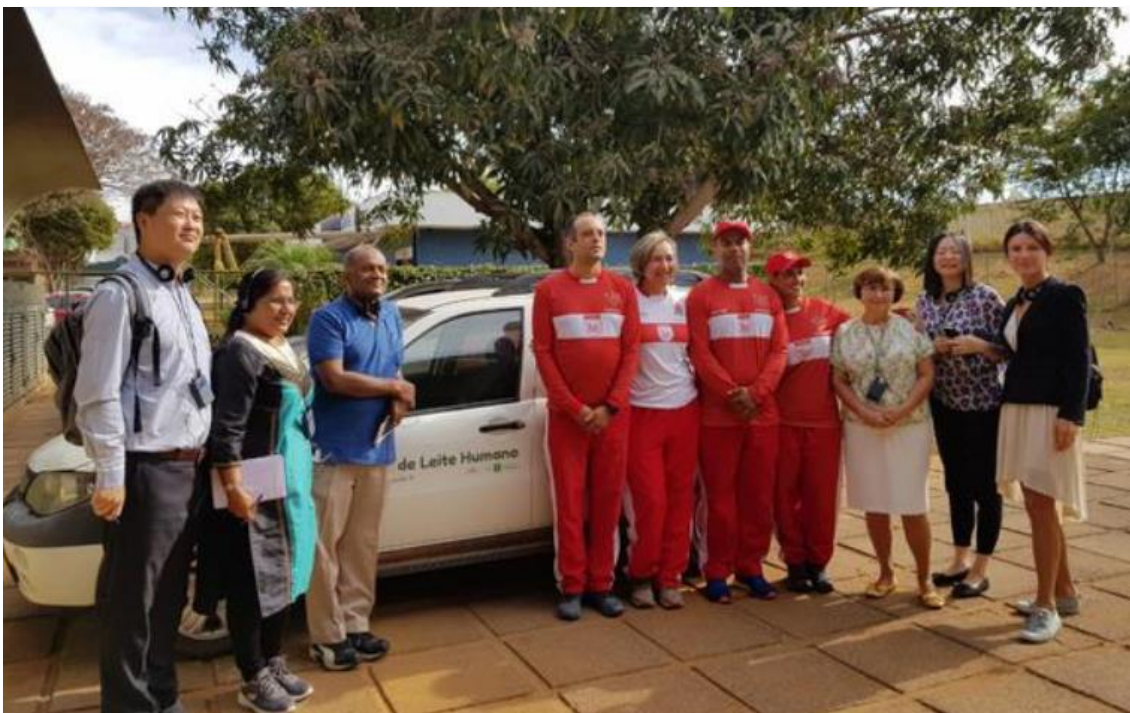
Conhecendo o Projeto Bombeiro Amigo do Peito

Durante a manhã do segundo dia de atividades, o grupo participou da rotina de processamento e controle de qualidade do leite humano, segundo o modus operandi praticado pelos Bancos de Leite Humano do Brasil. Os participantes receberam as boas-vindas de toda a equipe do BLH de Taguatinga e em seguida conheceram o Projeto Bombeiro Amigo do Peito, iniciativa conjunta da rBLH-DF com o Corpo de Bombeiros Militar para coleta domiciliar.