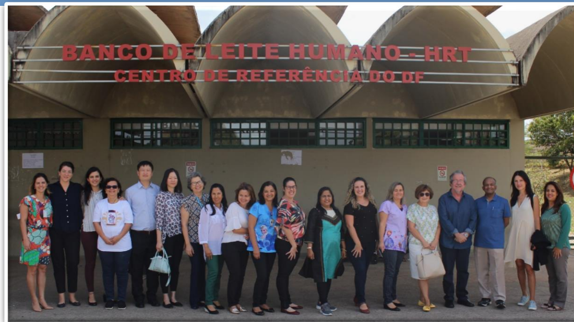
Participantes em visita ao Centro de Referência para BLH do Distrito Federal

Haja visto o reconhecimento pela Organização das Nações Unidas quanto ao impacto positivo da experiência brasileira, foi elaborada, no encerramento do Workshop, a Declaração da Primeira Reunião do BRICS em Banco de Leite Humano que marcou o compromisso de mobilizar esforços para a criação da Rede de Bancos de Leite Humano do BRICS.