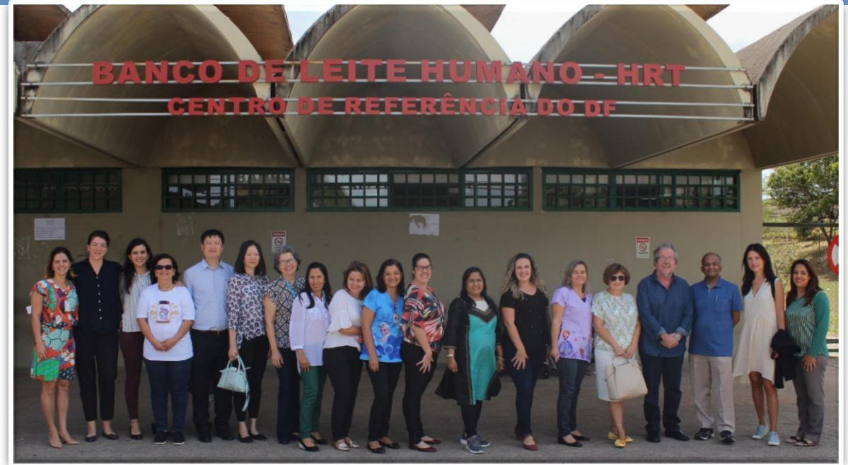
Participantes en visita al Centro de Referencia para BLH del Distrito Federal

Considerando el reconocimiento por la Organización de las Naciones Unidas cuanto al impacto positivo de la experiencia brasileña, fue elaborada, en la clausura del Workshop, la Declaración de la Primera Reunión de BRICS en Banco de Leche Humana que marcó el compromiso de movilizar esfuerzos para la creación de la Red de Bancos de Leche Humana de BRICS.