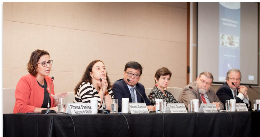
Mesa de la Solemnidad de Apertura