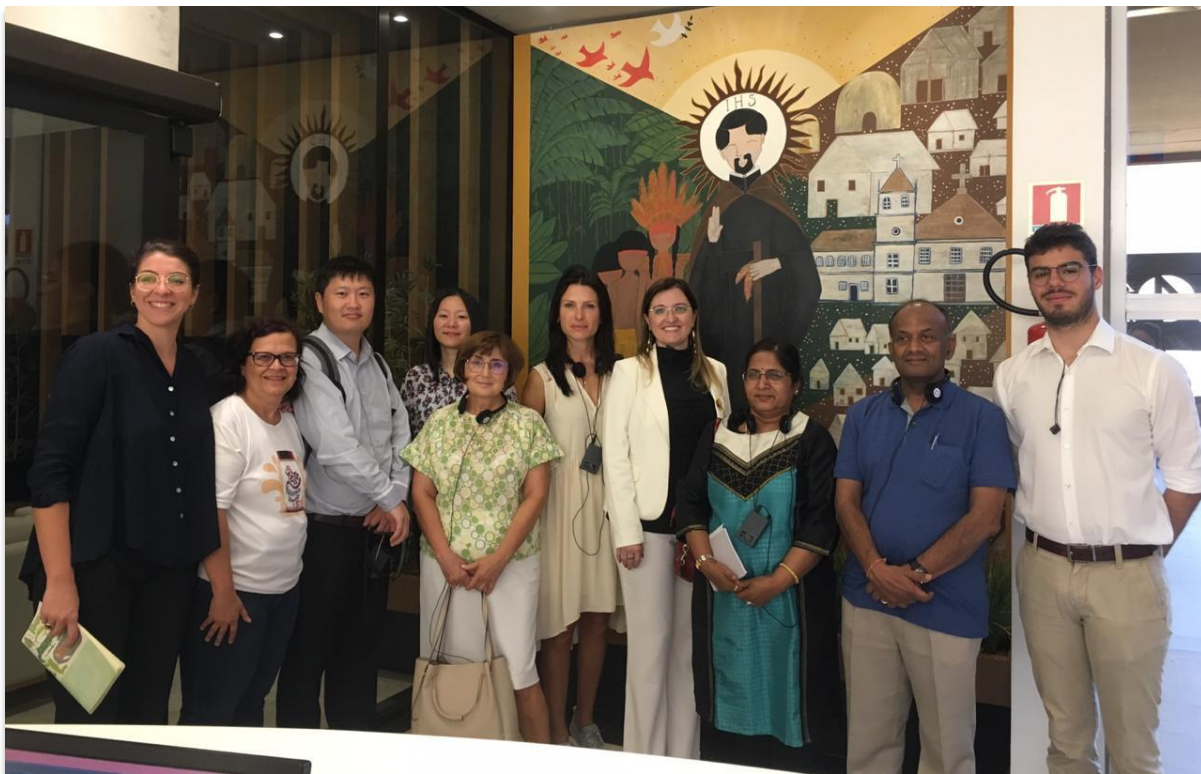
Visita al BLH del Hospital Anchieta

En la tarde del mismo día, los participantes visitaron el BLH del Hospital Anchieta, que integra la Red de Salud Suplementaria del Sistema Único de Salud. Los participantes conocieron, en la práctica, la Ley Brasileña de 1993, renovada en 2014, que obliga a los Hospitales que disponen de UCI neonatal a tener un Banco de Leche Humana o Puesto de Recolección en sus instalaciones.