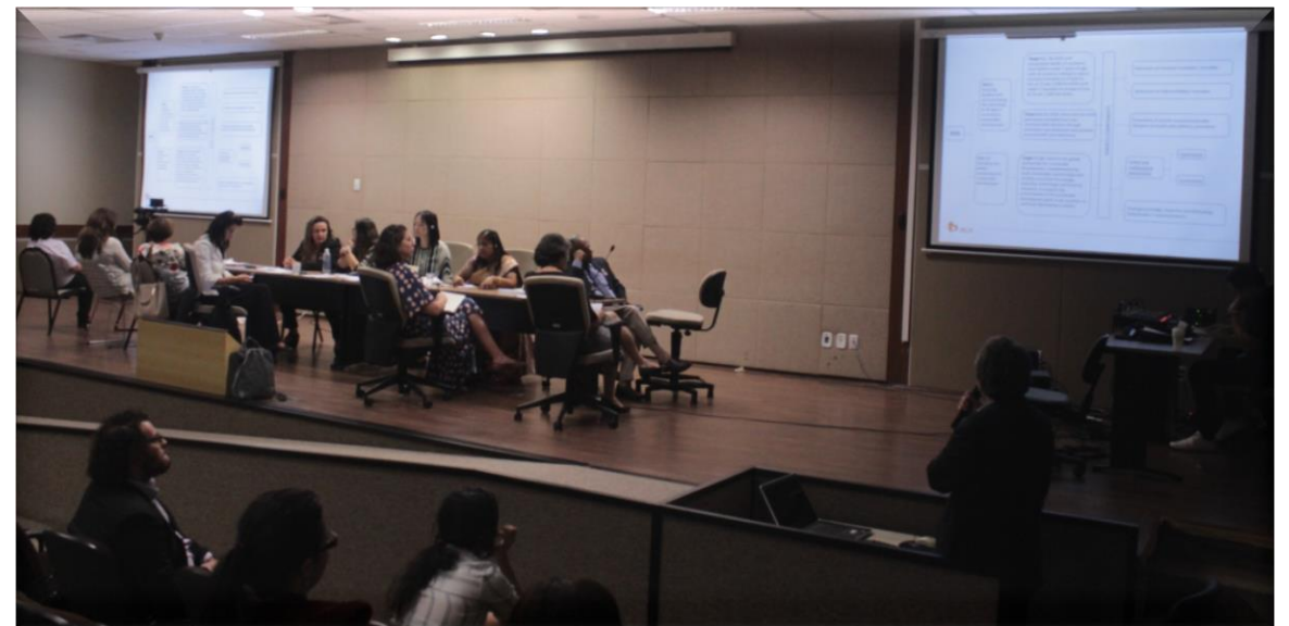
Conferencia - La Red Global de Bancos de Leche Humana en el contexto De la Agenda 2030 para el Desarrollo Sostenible