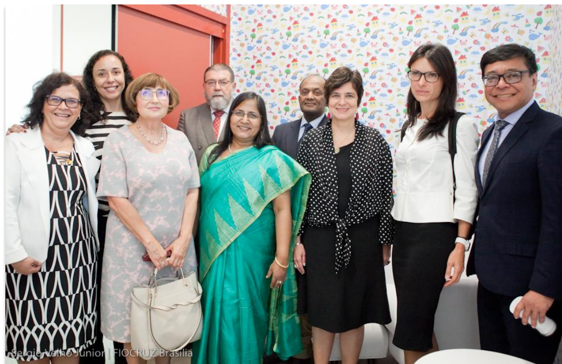
Inauguración de la Sala de Apoyo a la Mujer Trabajadora que Amamanta de la Gereb/Fiocruz Brasília

Al término de la solemnidad los representantes de BRICS fueron invitados a participar de la inauguración de la Sala de Apoyo a la Mujer Trabajadora que Amamanta, de la Gereb/Fiocruz-Brasilia. Cabe destacar que esta iniciativa tiene el propósito de apoyar a la mujer que amamanta al momento en que retorna al trabajo.