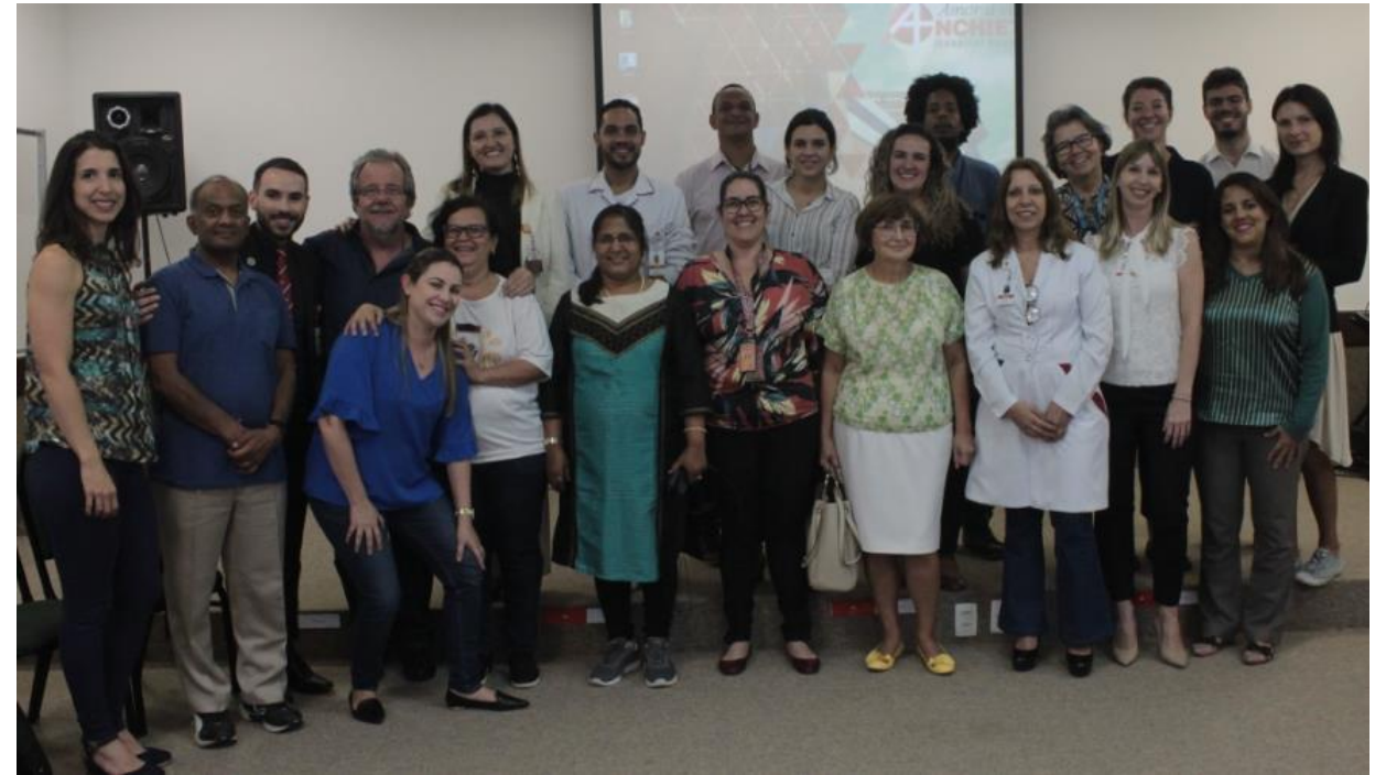
Participantes del Workshop siendo recibidos por el equipo del Hospital Anchieta