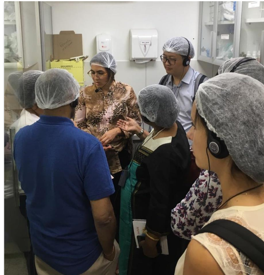
Visita al BLH del Hospital Anchieta