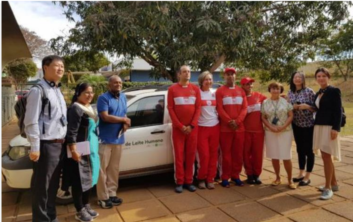
Conociendo el Proyecto Bombero Amigo del Pecho

Durante la mañana del segundo día de actividades, el grupo participó de la rutina de procesamiento y control de calidad de leche humana, según el modus operandi practicado por los Bancos de Leche Humana de Brasil. Los participantes recibieron la bienvenida de todo el equipo del BLH de Taguatinga y enseguida conocieron el Proyecto Bombero Amigo del Pecho, iniciativa conjunta de la rBLH-DF con el Cuerpo de Bomberos Militar para la recolección domiciliaria.