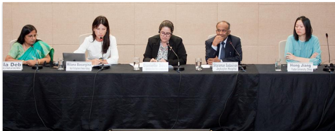
Mesa compuesta por los representantes de Brasil, Rusia, India y China

La segunda actividad del Workshop fue la realización del Panel Panorama de los Bancos de Leche Humana en los países que integran BRICS – en el cual los representantes de Rusia, India y China presentaron el estado de arte de la lactancia materna y Bancos de Leche Humana en sus respectivos países. El panel permitió conocer como cada país lida con el tema Banco de Leche Humana en sus respectivos contextos de salud pública.